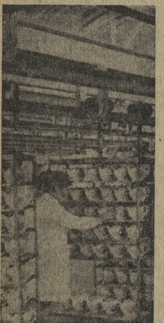
На снимке: доменная печь № 4.

АЗЕРБАЙДЖАНСКАЯ ССР. Свыше 65 тысяч изделий ежедневно изготавливает Кировбадский фарфоровый завод имени 50-летия Советского Азербайджана. Продукция предприятия — украшенные национальным орнаментом изящные чайные и столовые сервизы — пользуется большим спросом. Коллектив завода обязался в этом году дать 200 тысяч изделий сверх задания. Своё слово трудящиеся предприятия с честью держат, повышают качество продукции. На снимке: продукция завода.