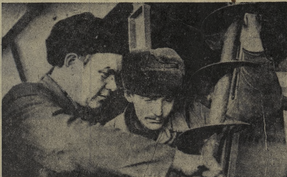
■ СЕЛЬСКОЕ ХОЗЯЙСТВО — НА ПРОМЫШЛЕННУЮ ОСНОВУ

Подсчеты такие. Более двух тысяч человек встанут