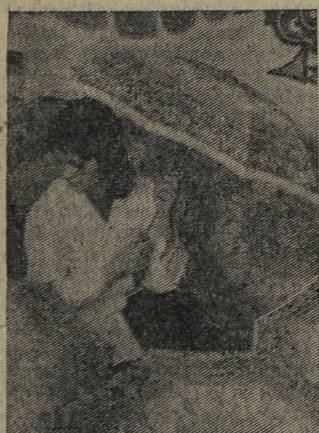
ТОВАРЫ — НАРОДУ

Конструкторской группой по созданию новых видов товаров широкого потребления Ивано-Франковского приборостроительного завода разработаны и подготовлены к производству новый вариант складного женского зонта.