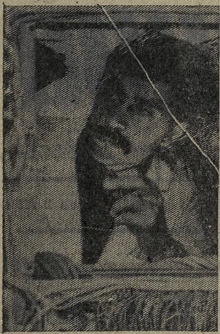
КОМПЬЮТЕРЫ РОЖДАЮТСЯ В ЕРЕВАНЕ

ЭВМ «ЕС-1030» — новейшая разработка Ереванского научно-исследовательского института математических машин. Она выполнена в содружестве со специалистами ПНР. Этот усовершенствованный компьютер третьего поколения способен решать одновременно до пятнадцати задач.