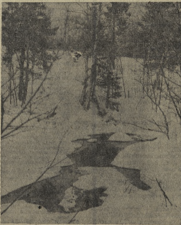
Парадоксы февраля.

пять головок Торчали бодро из него. Птенцы простых семян еловых Просили, только и всего. И мать спешила. Шашку быстро Получит, семя наберет, Потом разделит их малышкам Да тихо песню им споет. Уж темнота широкой тенью Ползла ко мне. Крепчал мороз. А я стоял, смотрел с вольным На милых птиц с названьем — клест. А. ХРАМЦОВ, егерь. Нижнее Село.