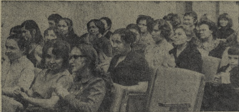
Завтра концерт Государственного Московского хора