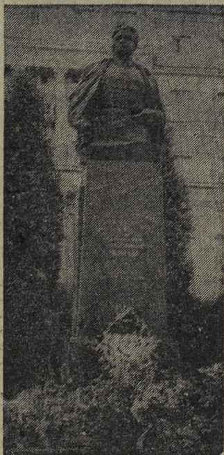
Текст и фото Д. Киреева.

Город Львов, улица Ивана Франко, дом № 5. Напротив этого здания высится памятник легендарному разведчику, уральцу Николаю Ивановичу Кузнецову. Здесь 9 февраля 1944 года он совершил покушение на гитлеровских высокопоставленных лиц — вице-губернатора Бауэра и доктора Шнайдера.