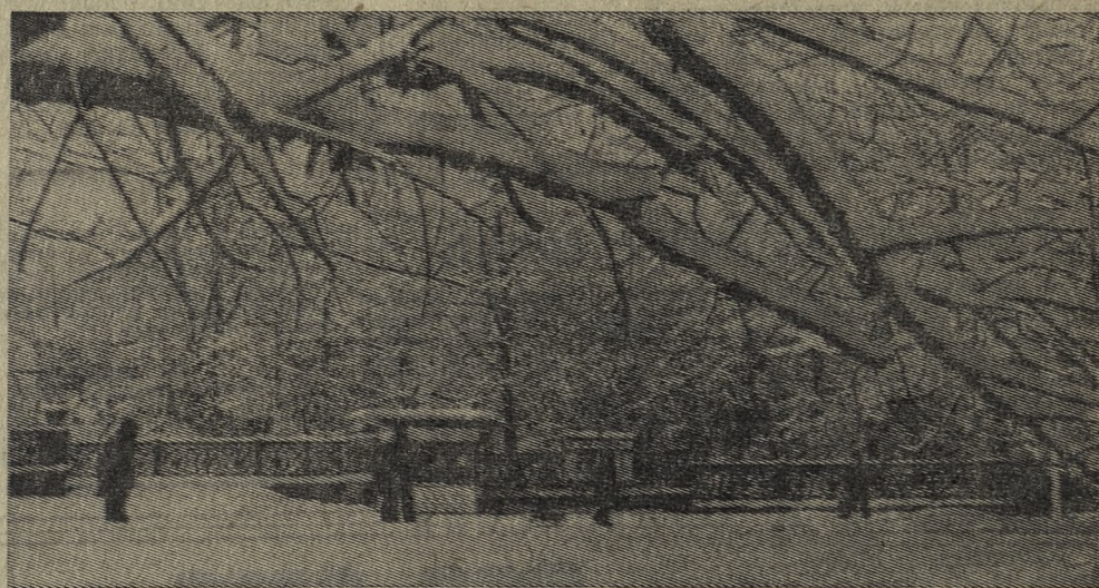
Соцгород. Зимний сквер.

Накат подгнил и рухнул вниз. В провал скатились камни, сучья, Надуло прошлогонный лист, Кой-как прикрыв обломков кучу. В одном из темных уголков, Где было так удобно, сухо, Надежно скрывшись от врагов, В гнездо утеслась капалуха. Спокойно время протекло — С дождями в мае было скупо — И птицы ровное тепло Родило жизнь внутри скорлупок. Птенцы, обсохнув, разбрелись По всем щелям, ища прохода. Спасти им слабую жизнь