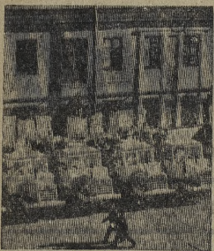
Коллектив Таллинского эскизавторского завода имени 50-летия СССР успешно выполняет задания четвертого, определяющего года пятилетия. Высококачественные машины завода находят применение в ряде союзных республик, экспортируются в 30 государств Европы, Америки, Азии и Африки.