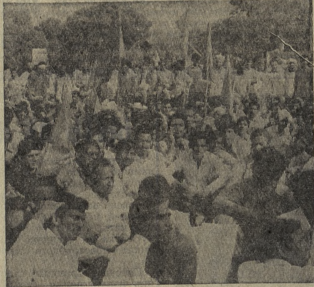
В Индии проходит кампания борьбы против происков реакционных сил, направленных на подрыв демократических завоеваний страны. Митинг и демонстрация против дельцов «черного рынка», спекулянтов и укрывателей товаров широкого потребления состоялась в Дели. На снимке: во время митинга.