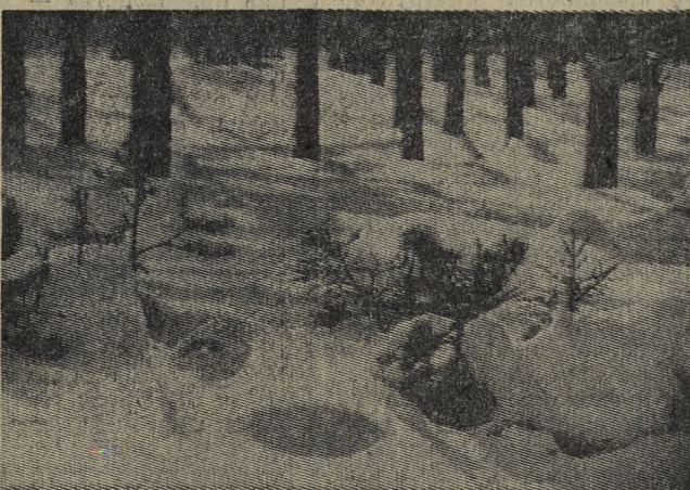
Тени на снегу.