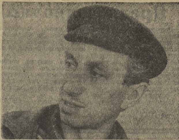
■ СО СТРОИТЕЛЬСТВА ЛАЙСКОГО СВИНООТКОРМОЧНОГО КОМПЛЕКСА