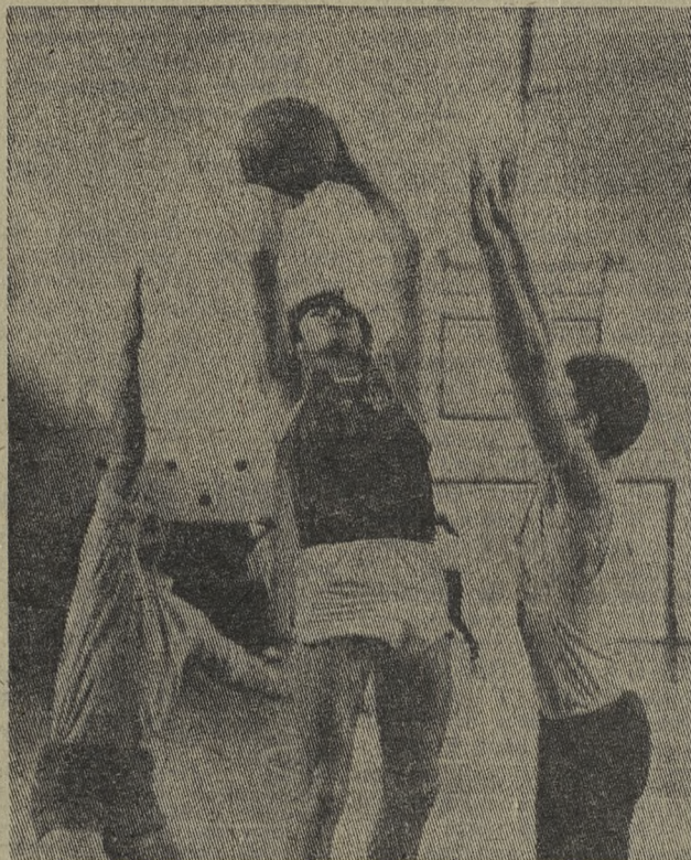
Секция баскетбола на хромпиковом заводе существует много лет. Она одна из многочисленных, в ней занимаются около 70 человек.