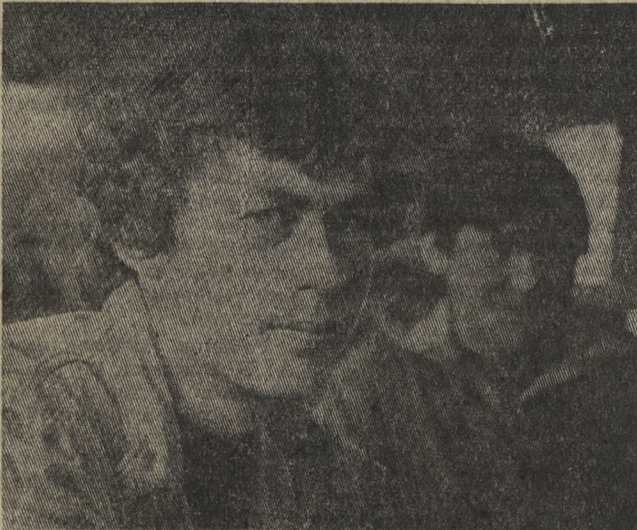
Из редакционной почты