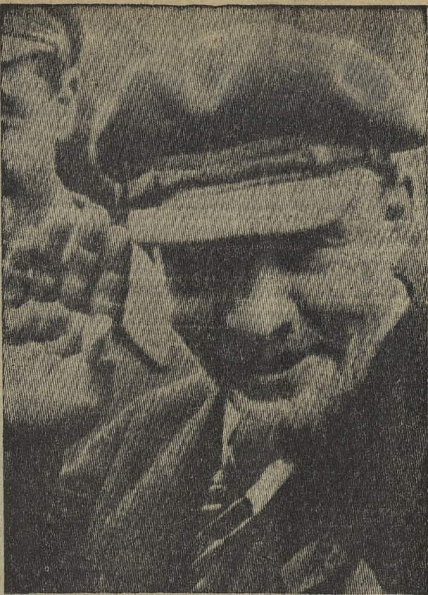
В. И. Ленин на закладке памятника «Освобожденный труд». 1 Мая 1920 года.