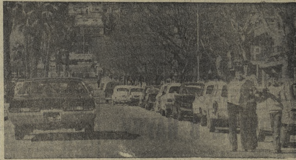
17 апреля сирийский народ отмечает 26-ю годовщину вывода иностранных войск с территории страны. Английские и французские войска, находившиеся в стране с 1918 года, в результате упорной борьбы сирийского народа и при поддержке демократической общественности всего мира были вынуждены в 1946 году убраться из Сирии. С этого времени страна получила возможность встать на путь независимого развития и освобождения экономики страны от господства иностранных монополий.