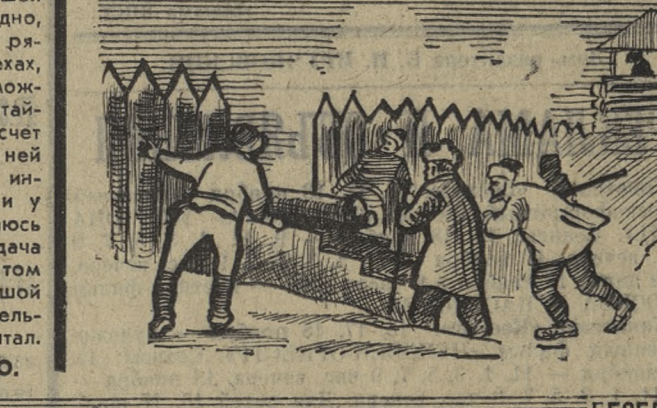
БЕСЕДА НА МЕЖДУНАРОДНЫЕ ТЕМЫ