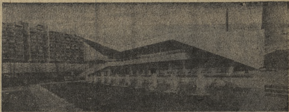
Берлин. Стройные силуэты современных зданий, широкие площади и проспекты, бульвары, газоны, обилие воздуха и света — таков новый центр столицы Германской Демократической Республики, построенный руками немецких тружеников. Некоторые его сооружения уже успели стать известными достопримечательностями города.