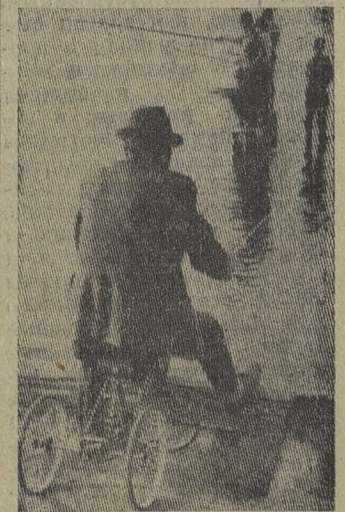
■ ОБЪЕКТИВ УЛЫБАЕТСЯ