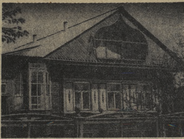
МИР НАШИХ УВЛЕЧЕНИЙ

Спектакль явно пришелся по душе аудитории. Не первый раз он идет на сцене, но с каким вниманием и