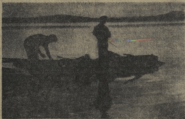
На утренней зорьке.