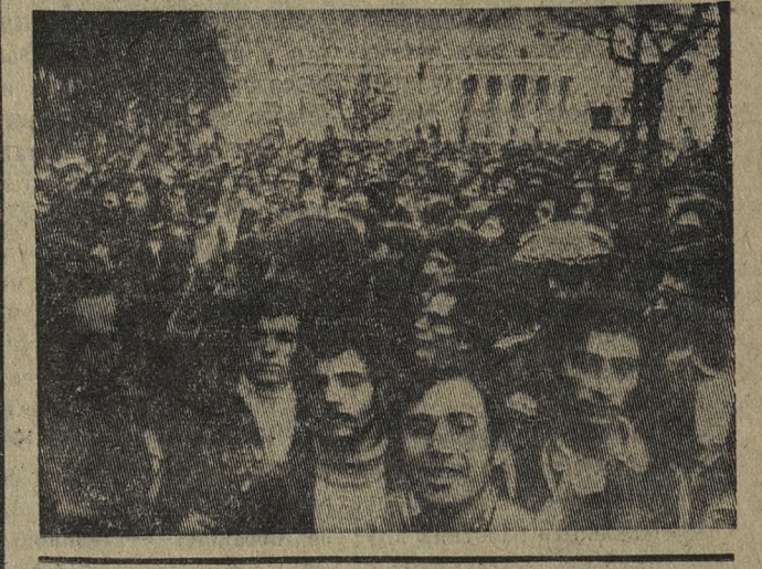
На снимке: демонстрация жителей Лиссабона.

Политическая жизнь в Португалии вступает в важный этап — идет подготовка к созданию временного правительства, которое будет проводить свободный выбор.