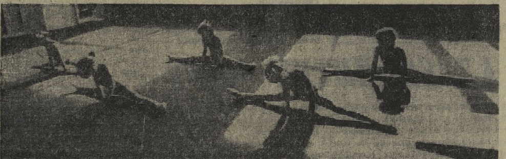
Немало юных пионеров занимается в гимнастической секции спортклуба «Уральский трубник». НА СНИМКЕ: на тренировке.