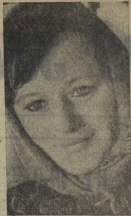
■ ПЕРЕДОВИКИ ЧЕТВЕРТОГО, ОПРЕДЕЛЯЮЩЕГО ГОДА ПЯТИЛЕТКИ