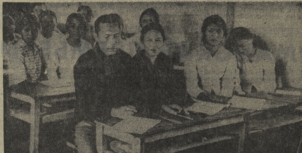
Народно-революционные власти Южного Вьетнама уделяют большое внимание ликвидации неграмотности. НА СНИМКЕ: идет урок в школе для взрослых района Чнеуфонг (провинция Куанчи). Многие из учеников — бывшие партизаны.