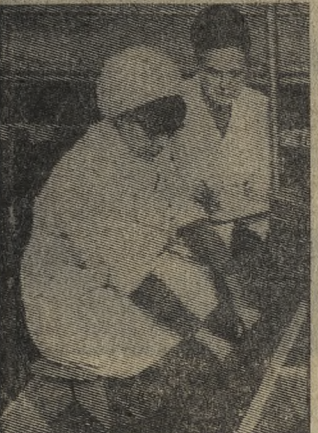
МОСКВА. Всесоюзный ордена Ленина проектно-исследовательский и научно-исследовательский институт «Гидропроект» имени С. Я. Жука — одна из крупнейших проектных организаций Советского Союза. В нем разработаны проекты гидроузлов Волжско-Камского каскада, Асуанского гидроузла (АРЕ), гидроэлектростанций на Днепре, Ангаре и Енисее, на реках Кавказа и Средней Азии и других частях СССР.