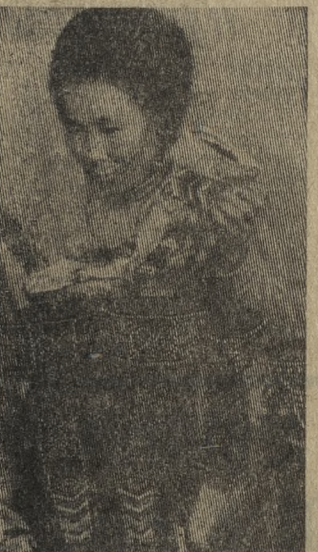
КРАСНОЯРСКИЙ КРАЙ. В сердце Сибири, в бассейне рек Подкаменной и Нижней Тунгусок, на сотни тысяч квадратных километров раскинулись таежные просторы Эвенкийского национального округа.