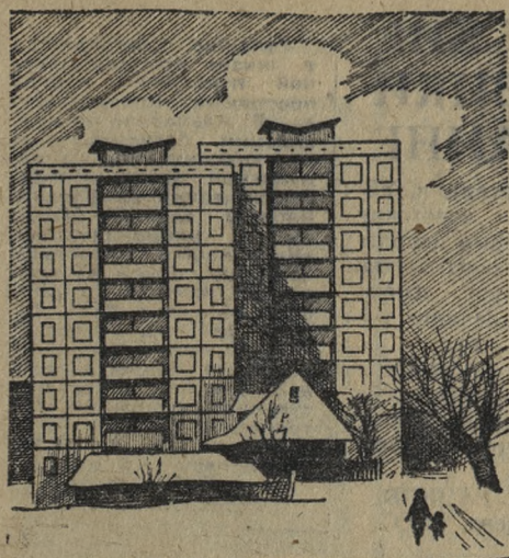
Отсюда начинаются новые микрорайоны.