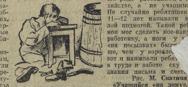
Рис. М. Скатица «Учашские «на дому»»

«Длинный ряд телег, иногда до сотни и более, каждая с фонарем, представлял картину, — описывает ночной обоз почетный член географического общества доктор О. Филли, участник экспедиции с А. Бремом. —