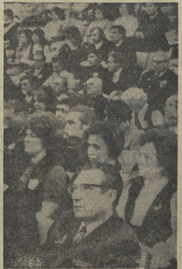
В зале заседаний конференции,

Мы находимся накануне XVII съезда ВЛКСМ. Дело чести каждого комсомольца — ознаменовать это событие успехами в труде и учебе.