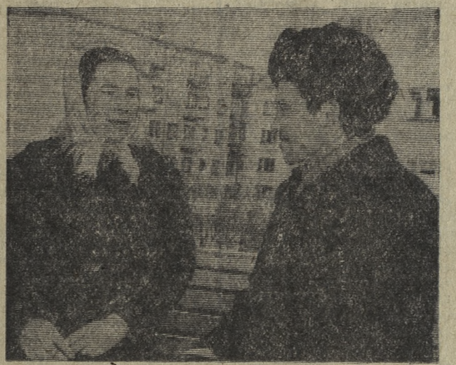
ПЕРЕДОВИКИ СОРЕВНОВАНИЯ ТРЕТЬЕГО ГОДА ПЯТИЛЕТКИ

Б. ГРИНБЕРГ, штатный корреспондент.