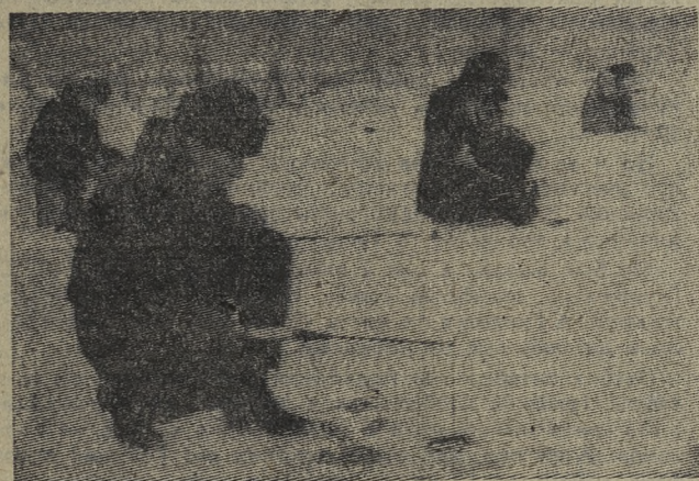
Время подледного лова.