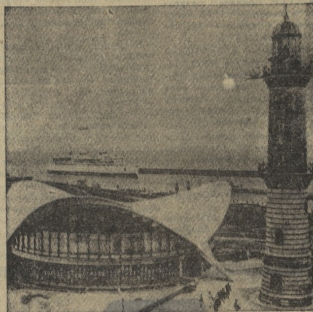
Германская Демократическая Республика. Курортный город и порт Варнемюнде на Балтийском море. Отсюда имеется паромное сообщение с Данией (Гесер). Курсырующие на этой линии современные корабли-паромы во все возрастающем масштабе осуществляют пассажирские и грузовые транзитные перевозки.