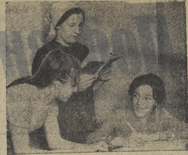
ГАЗЕТЫ И ЖУРНАЛЫ — КАЖДОЙ СЕМЬЕ!