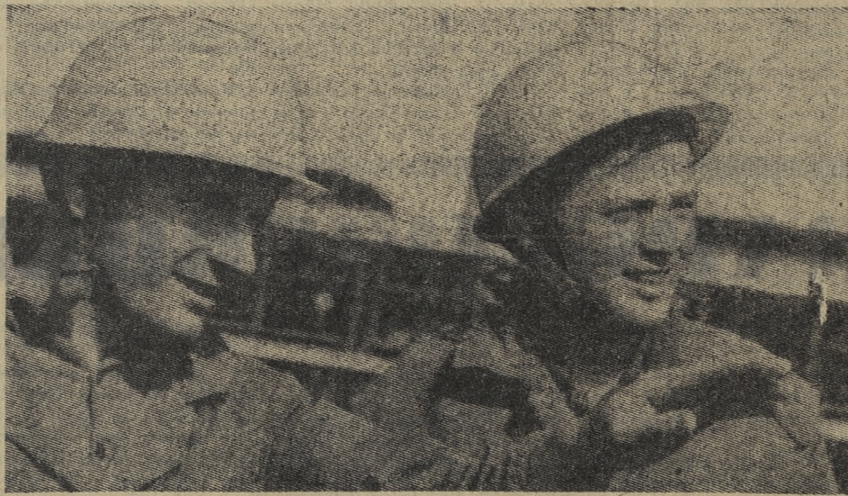
УБЕРЕМ КАРТОФЕЛЬ БЕЗ ПОТЕРЬ