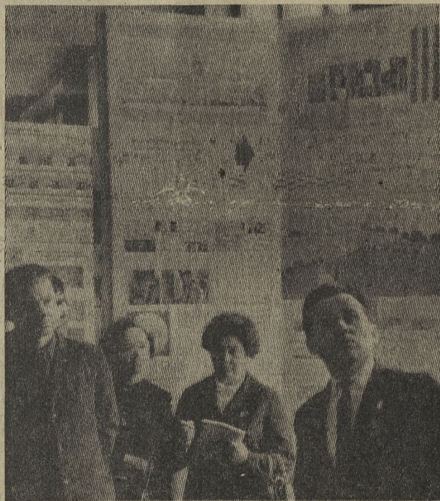
Партийные и профсоюзные активисты предприятий нашего города с интересом познакомились с областной выставкой наглядной агитации.

В. ПОЛУШКИН, инструктор отдела пропаганды и агитации горкома КПСС.