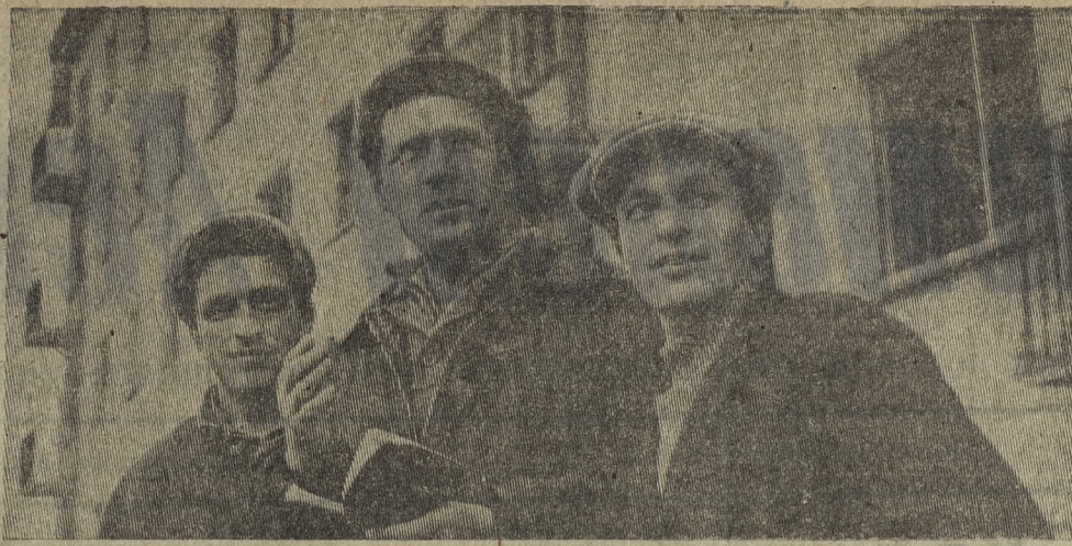
НА КОНКУРС: «ЧЕЛОВЕК ТРУДА — ГОРДОСТЬ ГОРОДА»