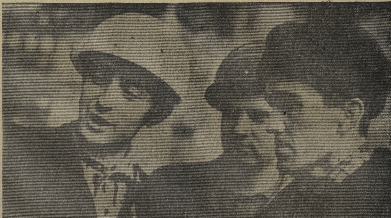
* Курс — интенсификация производства