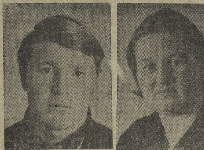
Знания, мастерство отдадут они любимому делу. Поэтому и достигают высоких результатов в соревновании за досрочное выполнение заданий третьего, решающего года пятилетки.