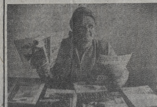
Выражаясь по душе