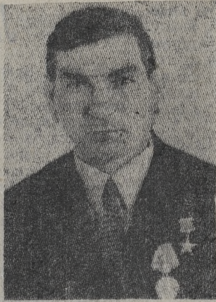
Календарный листок с алыми буквами «9 мая — Праздник Победы» открываю каждый год с воодушевлением.

28 лет назад отгремели последние залпы Великой Отечественной войны. Кажется, недавно сменили мы боевые гимнастерки на рабочие свиточки. А как преобразилась наша страна и страны социалистического содружества. Каждый день мира стал днем ударного труда, грандиозных свершений, которые, на первый взгляд, трудно уместить даже в воображении в этот прожитый период.