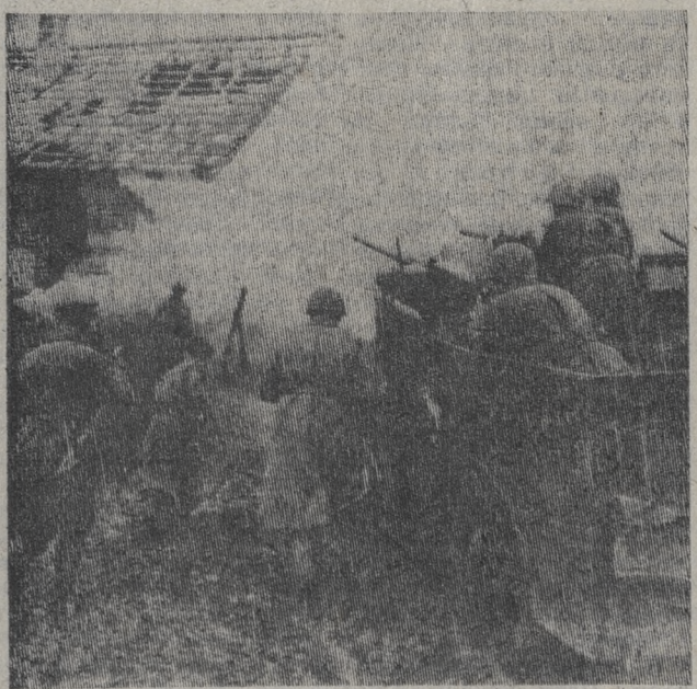
Советские солдаты ведут бой с гитлеровцами в одном из населенных пунктов Венгрии, 1945 год.