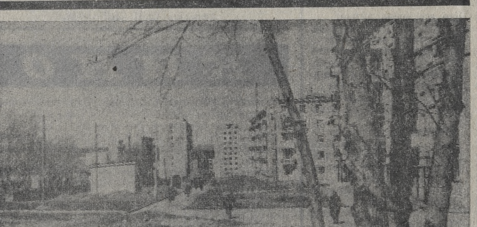
Но невозможно рассказать обо всем.

На днях выдан заказ — изготовить четвертому цеху металлургический склад для узлов сварочного трансформатора.