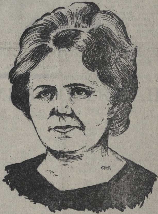
ПЕРЕДОВИКИ СОРЕВНОВАНИЯ ТРЕТЬЕГО ГОДА ПЯТИЛЕТКИ

Партомы Коуровского леспромхоза, Новотурбинного и хромпикового заводов, партбюро литейного завода также утвердили заведующих агитпунктами, новые составы агитколлективов.