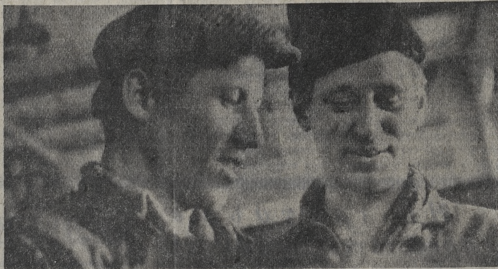
ПЕРЕДОВИКИ ТРЕТЬЕГО ГОДА ПЯТИЛЕТКИ

Развивать соревнование вширь и вглубь, добиваясь, чтобы оно строилось на прочном фундаменте двусторонних договоров — первейшая забота партийных и профсоюзных организаций.