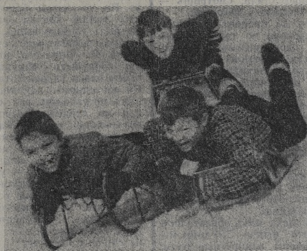
Снега становится с каждым днем все меньше и меньше. Вот и успевают детвора в эти дни наслаждаться зимними забавами.