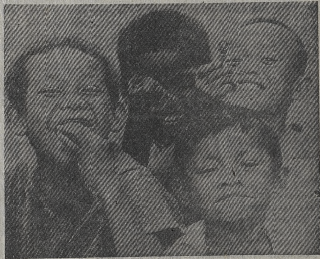
ИНДОНЕЗИЯ. Более 22 миллионов детей от 7 до 19 лет не могут учиться, потому что родителям нечем платить за их обучение. В стране не хватает школьных зданий, учителей, учебных пособий. На улицах Джакарты и других городов — толпы мальчишек, пытающихся заработать хотя бы несколько рупий.