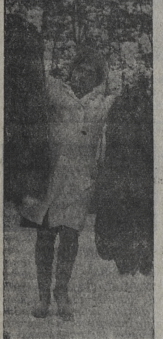
Татарская АССР. Одно из старейших звероводческих хозяйств республики — совхоз «Бирюлинский» в 1972 году достиг самого высокого уровня прироста молодняка.

Сейчас хозяйство ведет отpravку пушнины на заготовительные базы.