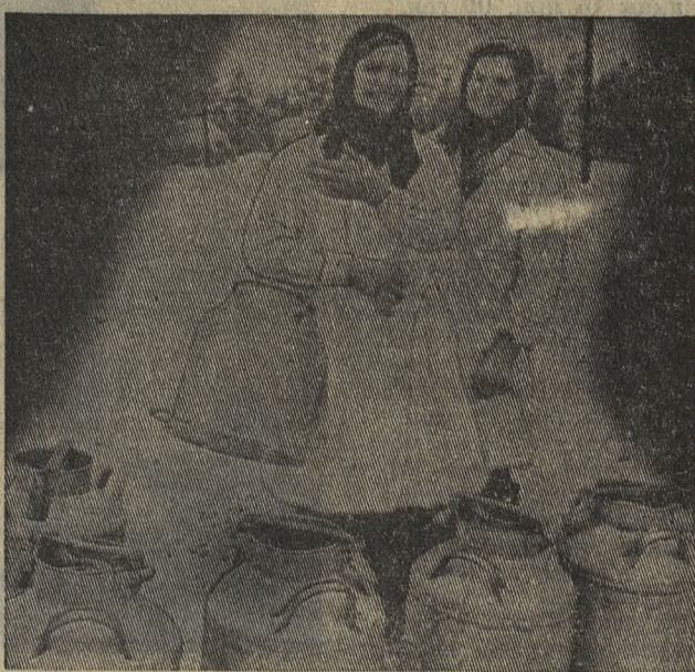
■ ПЕРЕДОВИКИ СОРЕВНОВАНИЯ В ЧЕСТЬ 50-ЛЕТИЯ СССР

Клички всех троих не случайно начинаются с одной и той же буквы — сестры от хорошей племенной коровы «Дорожки». «Досада» сейчас, после недавнего отела, дает по 26 литров молока в сутки. Сказывается, конечно, по-