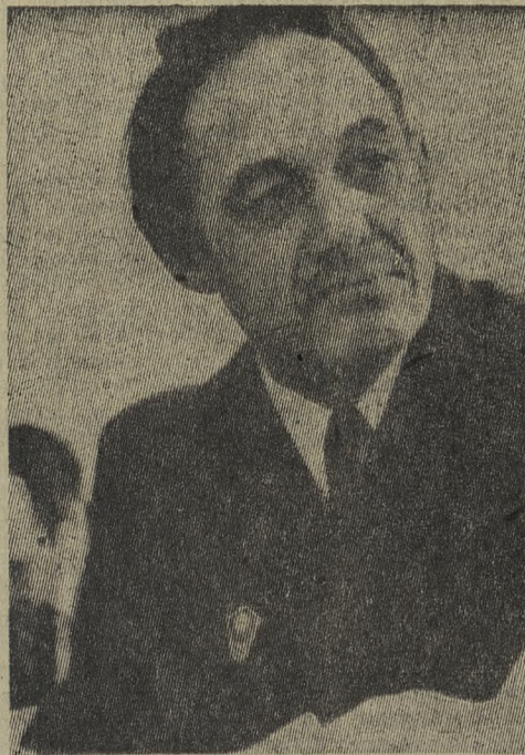
ЭКОНОМИЧЕСКИЕ ЗНАНИЯ — ВСЕМ