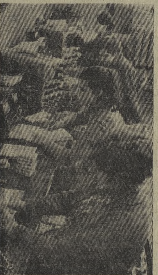
Есть в городе Калинин завод электроаппаратуры. Его основная продукция — логические элементы. Это небольшая коробочка из пластмассы, начиненная радиодеталями. Из них собираются самые различные схемы для управления технологическими процессами в металлургии, химии, энергетике, других отраслях народного хозяйства. Завод выпускает 70 видов логических элементов. Калининские «логик» экспортируются в 50 стран мира. Сейчас, в частности, выполняется заказ металлургов Индии. На снимке: проверка готовых «логик».