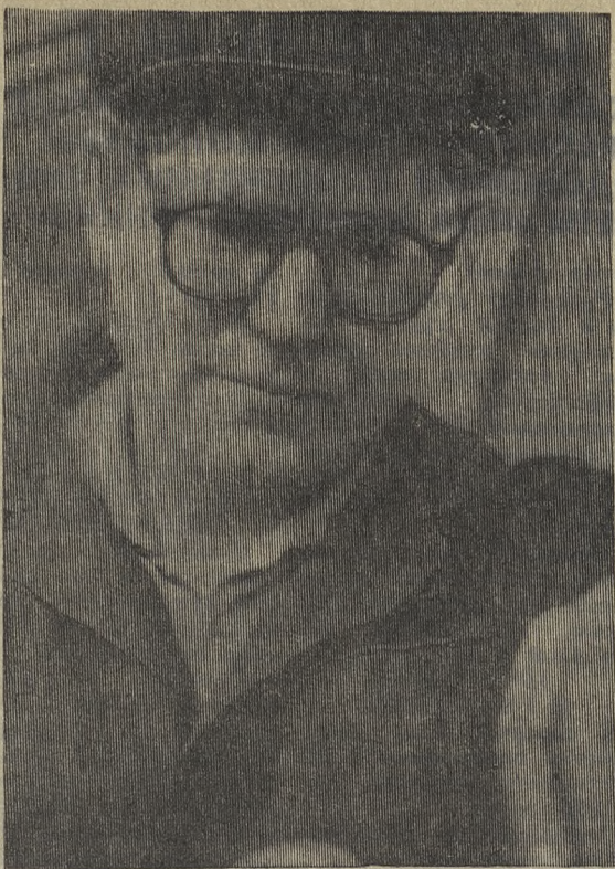
ЛЕТОПИСЬ ТРУДОВЫХ ВКЛАДОВ ПЕРВОУРАЛЬЦЕВ В ДОСРОЧНОЕ ВЫПОЛНЕНИЕ ПЯТИЛЕТКИ