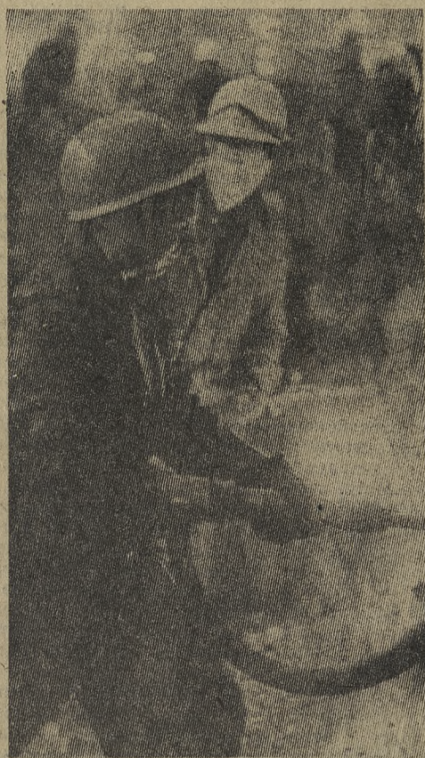
КАПИТАЛЬНЫЙ РЕМОНТ И РЕКОНСТРУКЦИЯ СТАНА «30-102»

Не лишним будет, если на каждом участке появится специальный стенд с показателями трудовой дисциплины. Желательно активнее пропагандировать положительный опыт коллективов, взявших под материальную ответственность трудовую дисциплину, добившихся успехов в этом важном направлении.