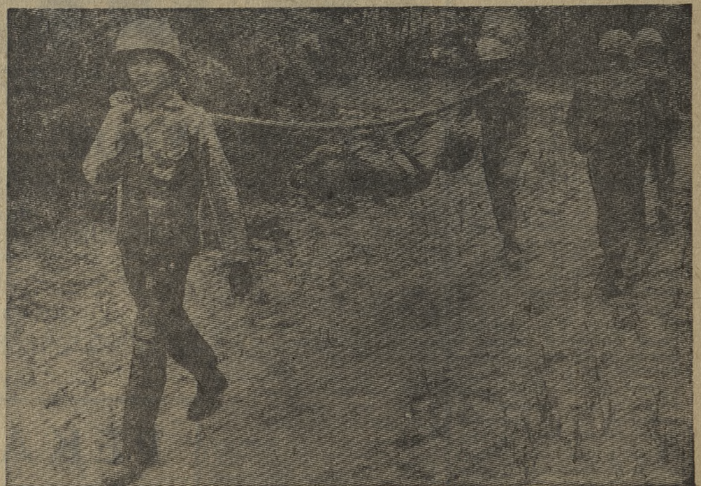
ЮЖНЫЙ ВЬЕТНАМ. Провинция Куангчи остается районом, где войска сайгонского режима несут самые большие потери под ударами патриотов НВСО. Только во время последних боев за высоты 74 и 105, недалеко от провинциального центра, противник понес значительные потери в живой силе и технике.

НА СНИМКЕ: последний путь солдата маркнеточной армии.