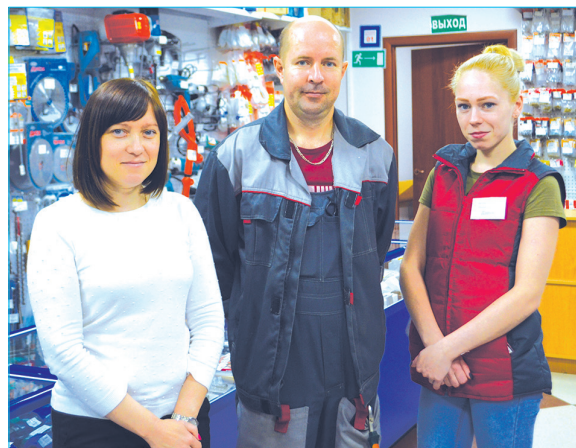
Сотрудники «Строймаркета» готовы вкладывать в работу душу