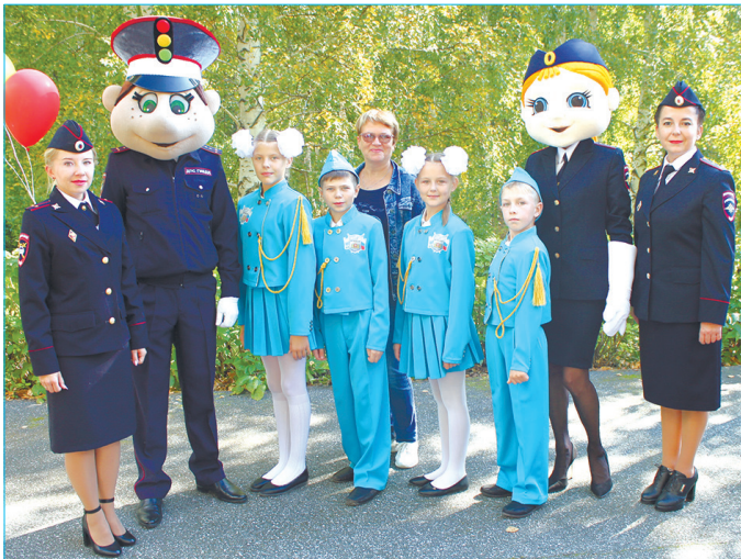
Ребята из Позарихи заняли 3-е место в областном конкурсе «Безопасное колесо – 2018»

Группа по пропаганде ОГИБДД Каменска-Уральского