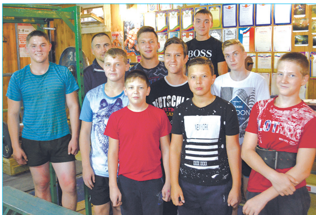
Будущие чемпионы из Покровского ФОК

Поначалу, когда учат технику, я оцениваю индивидуальные качества. Один через неделю восстановится, другой – через два дня. Все это учитываю, когда составляю план занятий для каждого, а потом ежедневно корректирую нагрузку, исходя из своего опыта и поставленной цели. У кого есть желание и цель, у того и получится.