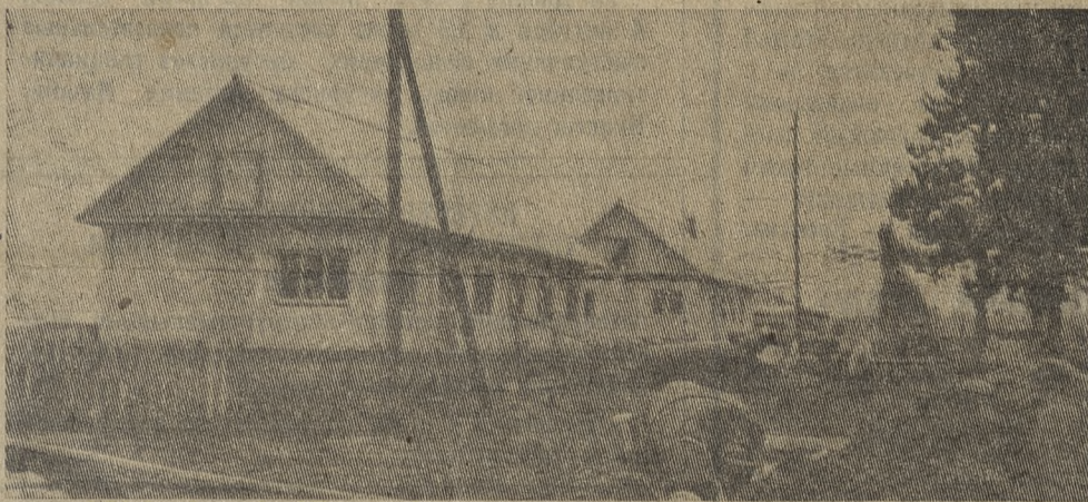
В совхозе «Русскопотамский» рождается новая улица — «Стадионная». НА СНИМКЕ: двухквартирные дома из крупных панелей.