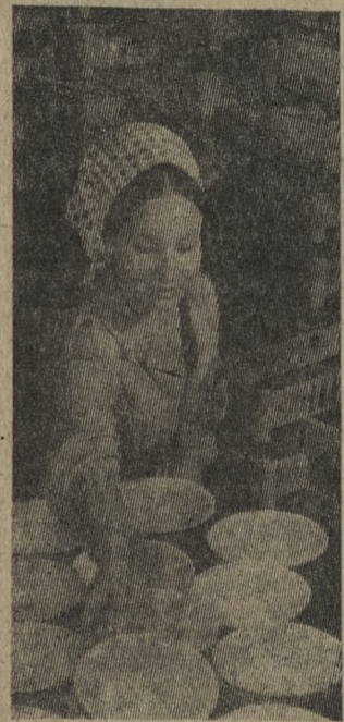
На Херсонском механическом заводе «Металлист» осваивается производство эмалированной посуды. Выпущены первые партии кастрюль, тарелок, мисок.