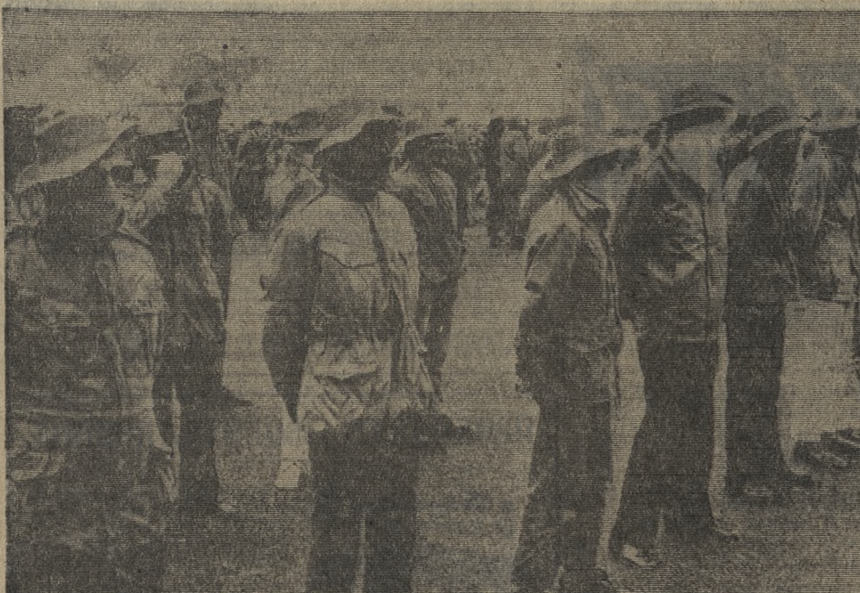
СЕВЕРНАЯ ИРЛАНДИЯ. Это они, протестантские ультра, нападают из-за угла, обстреливают в рабочих кварталах прохожих из машин, подвергают свои жертвы мучительным, зверским пыткам. В городах Ольстера по-прежнему находят трупы католиков, павших от рук неизвестных убийц. Многочисленные отряды убийц стараются запугать население католических кварталов, парализовать их готовность к сопротивлению.