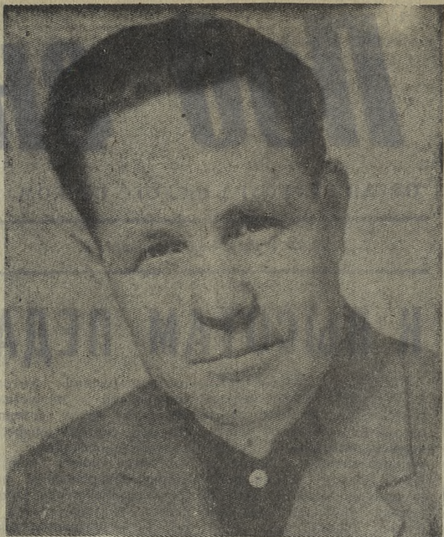
● О ЛЮДЯХ ОБЩЕСТВЕННОГО ДОЛГА