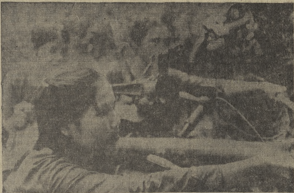
ЮЖНЫЙ ВЬЕТНАМ. Преодолевая невероятные опасности, отряд девушек-добровольцев из деревень прифронтовой полосы перевозит боеприпасы, используя обычные велосипеды (на снимке).

Таково положение на сегодняшний день. Оценивая его критически, трудно признать, что руководители СУ-3 и треста активно содействуют важному направлению в деятельности химиков: дополнительному выпуску продукции за счет реконструкции производства с минимальными затратами. А ведь именно такая задача определена для всех предприятий страны в Постановлении ЦК КПСС «Об опыте работы Свердловской партийной организации по увеличению выпуска продукции за счет реконструкции действующих предприятий с минимальными капитальными вложениями». Вовремя несвоенные ассигнования ведут к неизменным потерям. Об этом забывать нельзя.