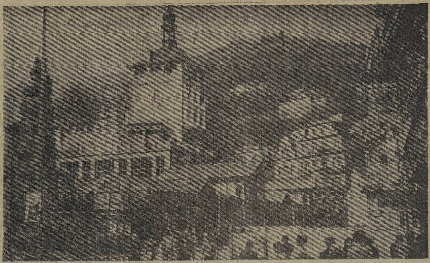
На снимке: Карловы Вары.

Одно из важных условий успешной работы почтальона — знание города и микрорайонов. Поэтому каждому предлагалось совершить заочный маршрут по родному городу и рассказать, где, какие находятся учреждения, организации.